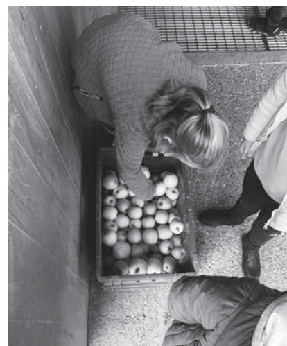
Une nouvelle fois, l'APENV organisera une distribution de pommes aux élèves.

Si vous souhaitez être tenu informé des activités de l'APENV et soutenir ses actions, n'hésitez pas à en devenir membre (cotisation de 30 francs par famille et par année scolaire). Vous bénéficierez également d'un tarif préférentiel sur les activités payantes. Pour toutes questions ou inscriptions,