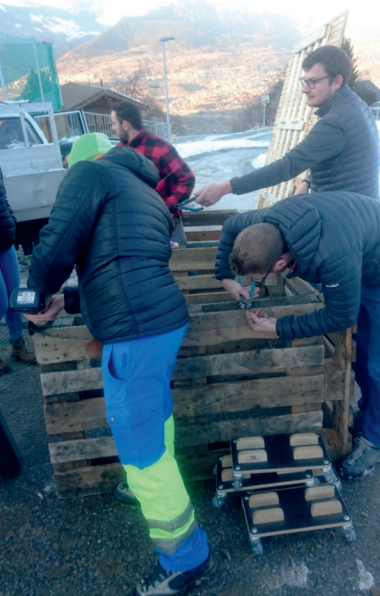
Des jeunes de Veysonnaz lors de la construction du composte collectif en janvier dernier

Une belle initiative collective de développement durable, qui a le plein soutien de la Commune !