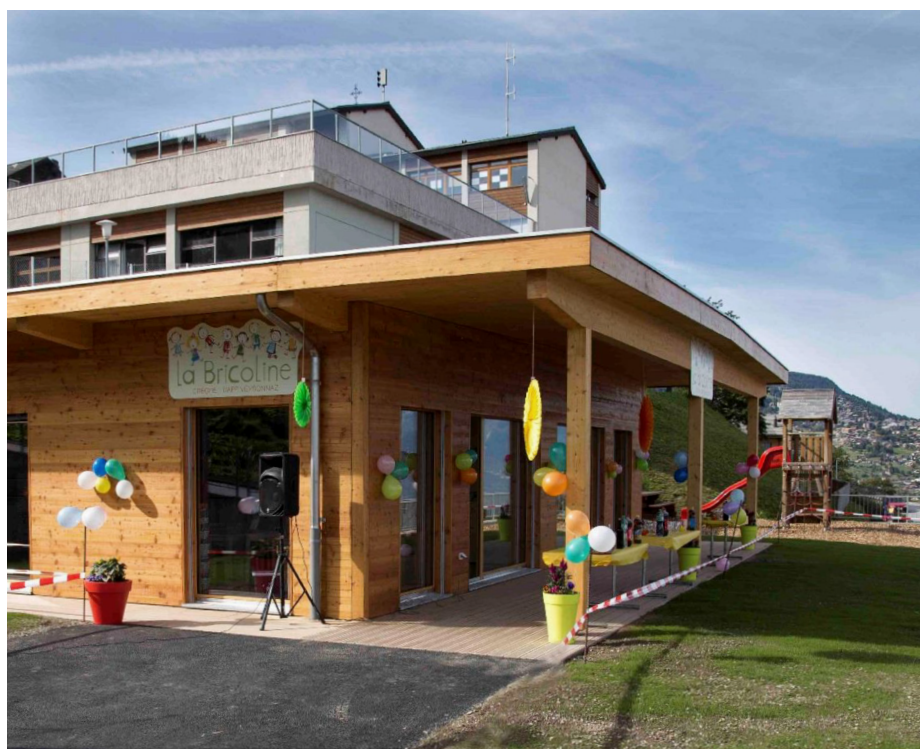
Vendredi 7 septembre, fête des 5 ans, 16 h 30 à la Bricoline